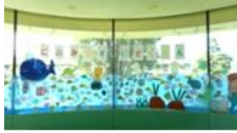
図書館を水族館にしよう