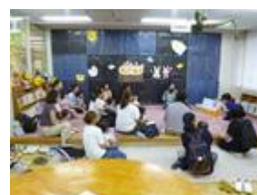
あかちゃんタイム

図書館職員やボランティア団体等による定期的なおはなし会や読み聞かせ会の充実を図ります。