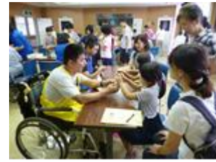
図書館プロジェクト