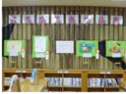
読書感想画の展示

幅広い年齢層の児童生徒や保護者が、図書館を身近に感じ、足を運ぶようにするために、行事内容の充実と広報活動に努めます。